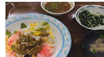
※写真は職員食になります。

献立 主食(主菜): あなごちらし 副菜: 冬瓜のそぼろあんかけ 副菜: 菜の花としらすのお浸し 汁: あさりの潮汁