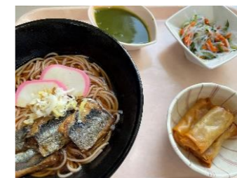
※写真は職員食の写真となります。

献立 主食:桜そば(にしんそば) 副菜:きゅうりの梅和え 副菜:春巻き 甘未:抹茶水ようかん おやつ:桜ゼリー