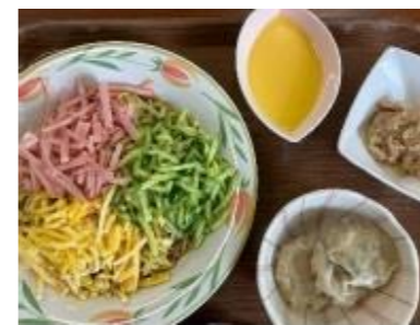
※写真は職員食になります。

献立 主食:冷やし中華 副菜:にら馒头 副菜:白菜とツナの和え物 デザート:マンゴープリン